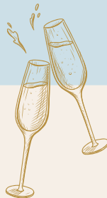
Basic, Royaal & Luxe